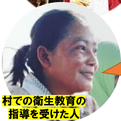
村での衛生教育の指導を受けた人

紙芝居や絵を使った内容でわかりやすく、実際、この講習が実施されてからは、下痢の発症数が減りました。